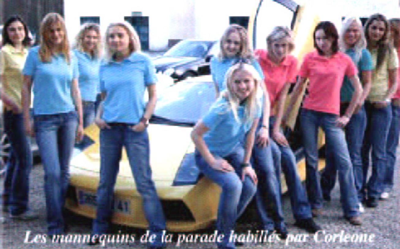
Les mannequins de la parade habillés par Corleone