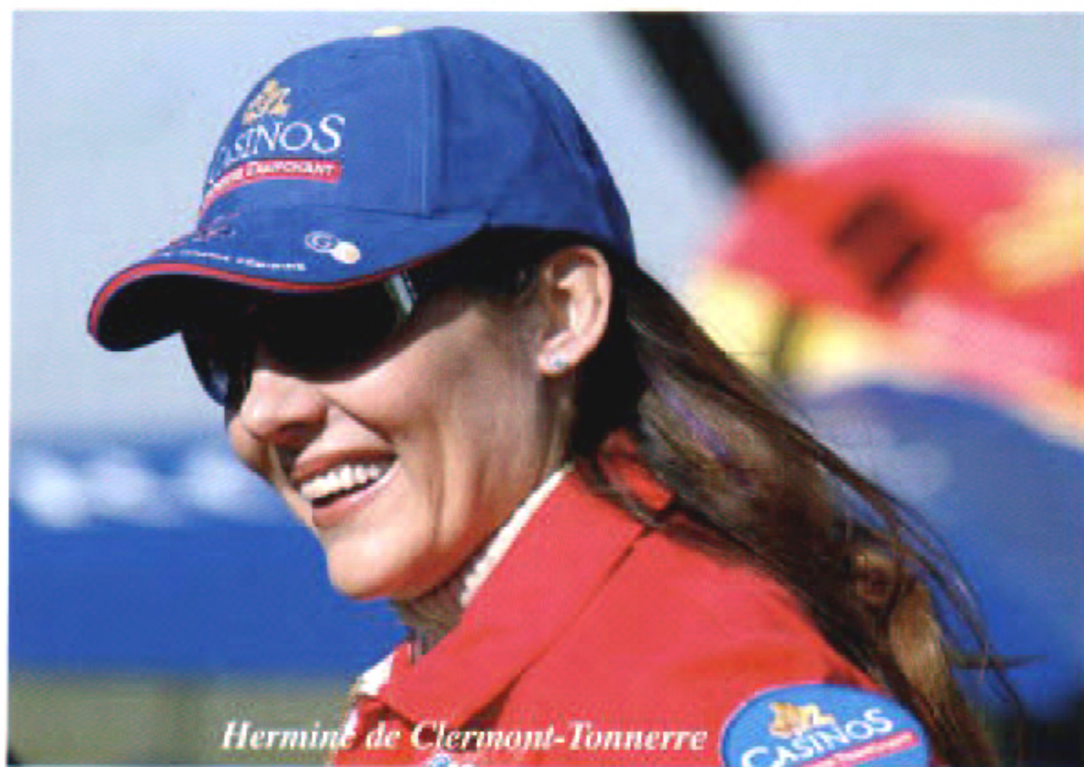
Hermine de Clermont-Tonnerre