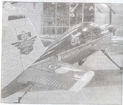
Un des avions de la patrouille féminine au sol...